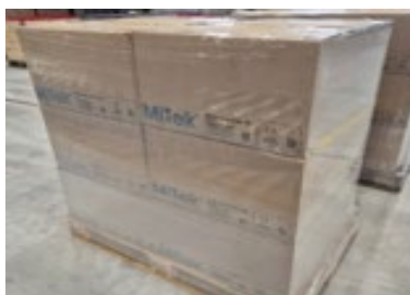
Löspack i kartong