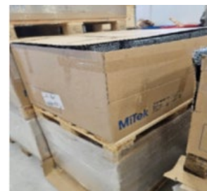
BigBox med bandade buntar