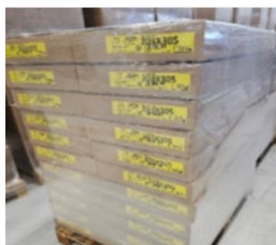
Bandade buntar i kartong